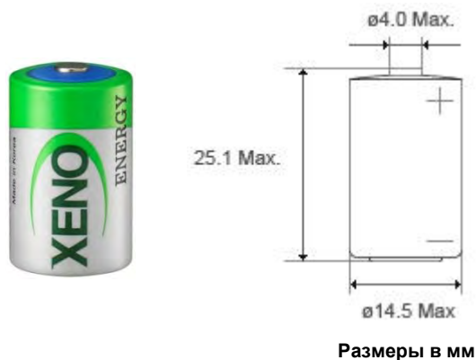
Размеры в мм

Способности Максимального импульса показывающий более 3,0 В на 60mA (0.1sec. каждые 2 мин. при 20 °C, 10 μA / см 2 ток базы с новыми батареями). Способность импульса может отличаться от статуса батареи и окружающей среды. Для восстановления максимального импульса, рекомендуется поддержка конденсатора.